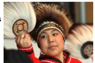
Centro Cultural de la Historia de La Herencia Nativa de Alaska