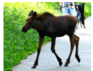
1,600 Moose en Anchorage